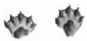
Pfotenabdruck des Fischotters

Der Otter ist perfekt an das Leben im Wasser angepasst. Nenne fünf Anpassungen an seinen nassen Lebensraum: