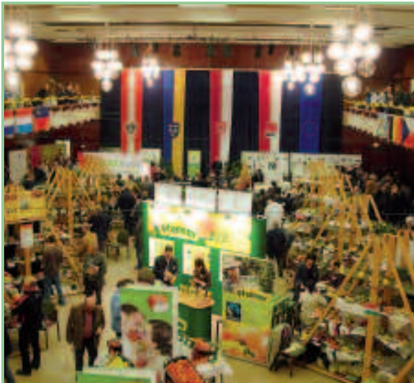
Blick in die Babenbergerhalle

Die internationale Obstausstellung Europom fand zwischen 26. und 28. Oktober 2012 erstmalig in Österreich in Klosterneuburg (NÖ) statt.