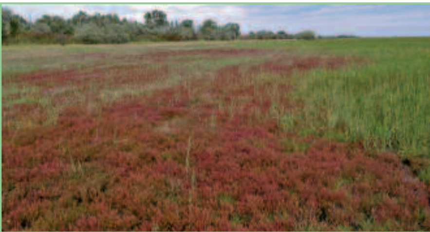
Quellerfluren im Oggauer Seevorgelände – ein IGA mit Vorkommen der Pannonischen Strandschrecke.

Das ELER-Projekt „Schutzprogramm für die bedrohten Heuschrecken des Nördlichen Burgenlandes“, im Rahmen der Sonstigen Maßnahmen – Ländliche Entwicklung, versuchte in den letzten vier Jahren den Wissensstand über diese für den Naturschutz sehr wichtige Gruppe entscheidend zu verbessern. Konkrete Schutz- und Pflegemaßnahmen, sowohl in- als auch außerhalb von Schutzgebieten können nunmehr gezielt für bestimmte Arten durchgeführt werden. Das ist umso wichtiger, als bislang bei Managementvorschlägen des Naturschutzes Erfordernisse der oft nur sehr kleinräumig verbreiteten wirbellosen Tierarten kaum berücksichtigt wurden; so ergänzen unsere Befunde sehr gut die bisherigen Managementmaßnahmen, wie das