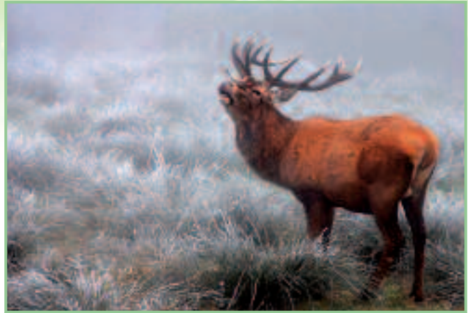
Rene Van Echelpoel, „Rothirsch im Nebel“

Siegerehrung und Ausstellung der besten Bilder auf Schloss Lackenbach