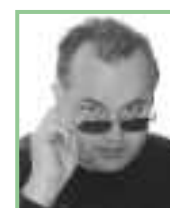
Text und Fotos: Dr. Josef Fally, Mitarbeiter des Naturschutzbundes Burgenland