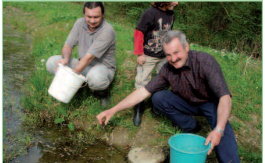
Flusskrebseinsatz in Rumpersdorf

Im Auftrag der Burgenländischen Landesregierung wurden von 2003 bis 2006 die Fließgewässer des Burgenlandes auf das Vorkommen von Flusskrebsen untersucht. Aufbauend auf dieser Bestandsaufnahme