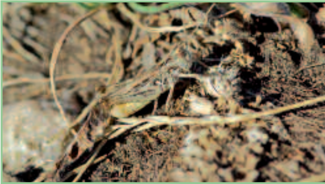
Der vom Aussterben bedrohte Felsgrashüpfer am Hackelsberg

breitet auftretende vegetationsarme Zickstellen. Verbreitete Charakterarten sind dabei die Breitstirnige Plumpschrecke, die Kurzflügelige Schwertschrecke und die Grüne Strandschrecke. Bemerkenswert ist auch das Vorkommen aller sieben im Nordburgenland vorkommenden Grillenarten.