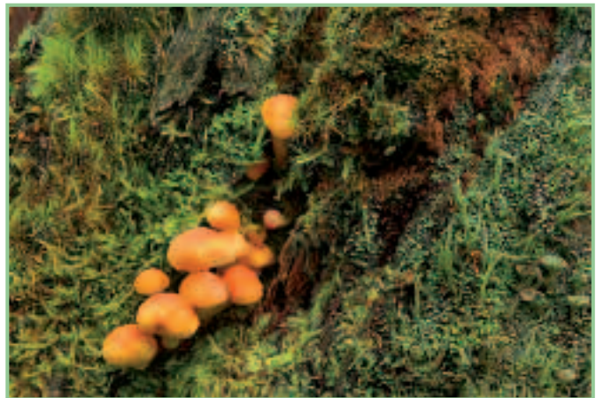
Franz Wippel, „Pilze am Baumstumpf“

Am 10. November 2012 fand die Siegerehrung und Ausstellungseröffnung des vom „Verband Österreichischer Amateurfotografenvereine (VÖAV)“, der Esterhazy-Privatstiftung Lackenbach und dem Naturschutzbund Burgenland organisierten 4. Natur-Fotowettbewerbes statt.