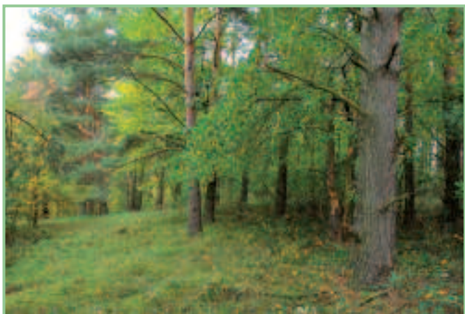
Naturwald in Lindgraben

Am 31. Oktober 2012 endete das Projekt „Außernutzungsstellung von Altbäumen“