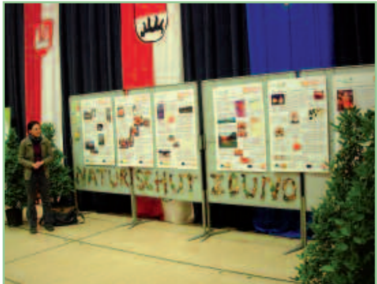
Verena Pilz mit der Streuobstausstellung des ÖNB Burgenland

Rund 5.000 Besucher stürmten die Obsterlebniswelt und konnten mehr als 1.000 Obstsorten aus 14 europäischen Ländern sehen und riechen, 40 alte Apfelsorten konnten verkostet und gekauft werden, wovon reichlich Gebrauch gemacht wurde.