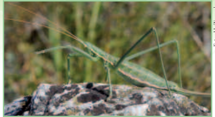
Die eindrucksvolle Sägeschrecke wurde nach längerer Zeit 2012 erstmals wieder am Zeilerberg nachgewiesen.