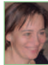
Projektleitung, Text und Fotos: Mag. Renate Roth, Bezirksgruppen- leiterin Mattersburg des Naturschutz- bundes Burgenland

Kleinstbiotope zu erhalten. Ein zusätzlicher Anreiz für die Kopfbaumpflege ist die landesweite Durchführung von Korbflechtkursen. Eine Renaissance der Flechtkunst gewährleistet einerseits das Wiederaufleben eines alten, aussterbenden Handwerks, vor allem aber ergibt sich aus erhöhter Korbflechtaktivität eine gesteigerte Nachfrage an dünnen Weidenruten, die nur dann gewonnen werden können, wenn Kopfbäume entsprechend gepflegt werden.