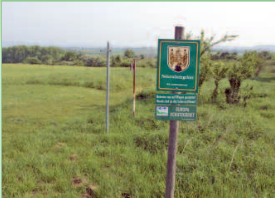
Tafel vor einem Naturschutzgebiet: Könnte man im kleinen Burgenland Schutzgebiete schaffen, die man samt Flora und Fauna einfach in Ruhe lassen müsste?