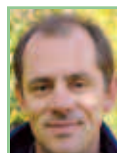
Text und Fotos: Mag. Manfred Fiala, Bezirksgruppenleiter Oberpullendorf des Naturschutzbundes Burgenland

Gemäß den Förderbedingungen werden alle drei Waldparzellen sich selbst überlassen (es gilt Prozessschutz), wobei beim Wald in Lindgraben vereinzelt forstliche Eingriffe unumgänglich sein werden.