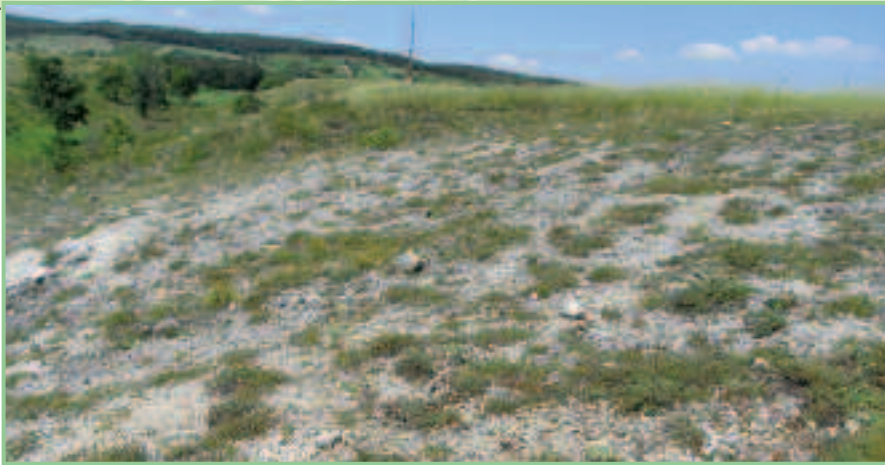
Felstrockenrasen in der Thenau bei Breitenbrunn – ein IGA mit Vorkommen des Felsgrashüpfers.

Als einzige der Raritäten des Neusiedlersee-Gebiets profitiert diese Art nicht von der Ausdehnung der Weideflächen, sondern benötigt höchstens extensiv genutzte Übergangsbereiche zwischen schütterem Schilf und offenem Boden auf stark salzigen oder schottrigen Standorten.