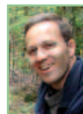
Autor und Foto: Dr. Georg Wolfram (Geschäftsführer der DWS Hydro- Ökologie GmbH)