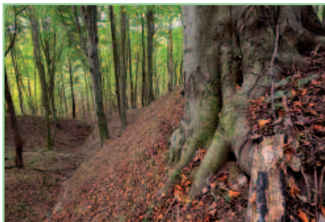
Naturwald in Rettenbach

„Buchstäblich“ in letzter Minute konnte noch ein lang geplanter Waldkauf in Lindgraben getätigt werden.