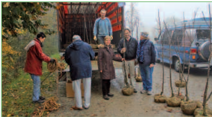
Beginn der Edelkastanienausgabe in Forchtenstein am 3. November 2012.

Im Rahmen unseres Edelkastanien-LEADER-Projektes fand am 3. November 2012 die dritte und letzte Pflanzaktion statt.