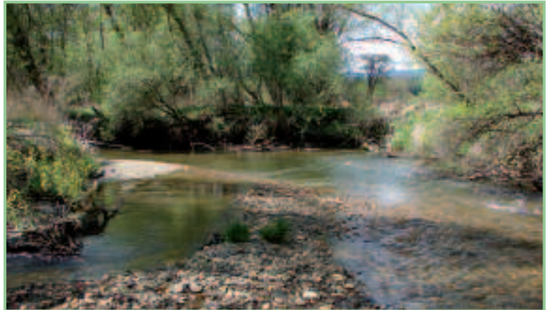
Die Lafnitz Höhe Kitzladen: ein hoch dynamischer Fluss - dem nur die Fische fehlen.

Die Lafnitz zwischen Neustift und Allhau bietet einen guten Anhaltspunkt für einen Langzeitvergleich des Fischbestands. Hier wurden bereits Anfang der 1990er Jahre quantitative