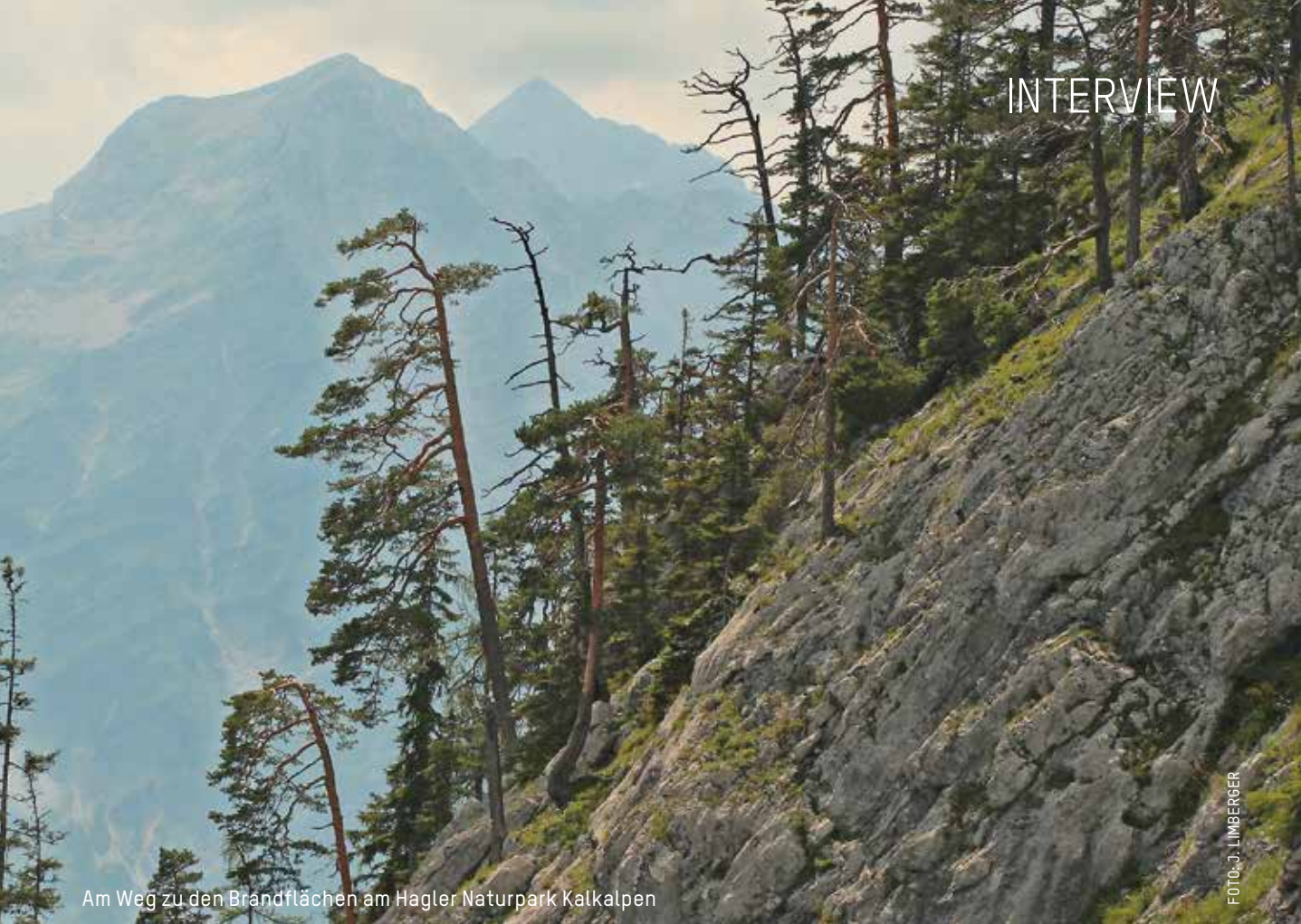
Am Weg zu den Brandflächen am Hagler Naturpark Kalkalpen