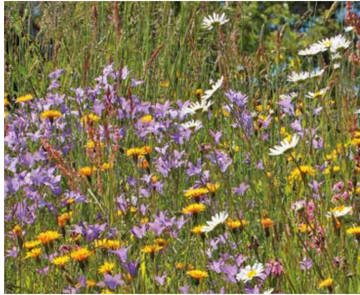
Blühende Sommerwiese FOTO: J. LIMBERGER

Kurzschwänziger Bläuling ( Cupido argiades ) FOTO: J. LIMBERGER