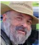
Text & Fotos: Josef Limberger, Obfrau-Stellvertreter | naturschutzbund | Oberösterreich

In heißen Sommern könnten brennende Windräder zu verheerenden Waldbränden führen! (FOTOMONTAGE)