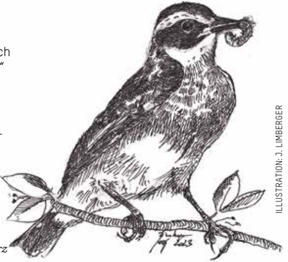
ILLUSTRATION: J. LIMBERGER

... die Braunkehlchen-Bestände rapide abnehmen und der 1970 noch weit verbreitete Wiesenvogel deshalb zum „Vogel des Jahres 2023“ ernannt wurde? Das Verschwinden von blütenreichen Wiesen und Brachen, der Verlust von abwechslungsreicher Vegetation mit höheren Halmen, Büschen und Ansitzwarten sowie der Insekten-schwund sind für den Bestandsrückgang in Österreich verantwort-lich. Helfen Sie mit, das Braunkehlchen ( Saxicola rubetra ) vor dem Aussterben zu retten, indem wir wieder mehr blütenreiche Wiesen und Brachen schaffen, Vogelschutzprojekte im Kulturland fördern und uns für eine Politik stark machen, die es Landwirt:innen ermöglicht, extensiv zu wirtschaften. Bitte Sichtbeobachtungen melden auf www.naturbeobachtung.at , um so den Bestand besser im Auge zu haben. Text: Mag. a Heidi Kurz