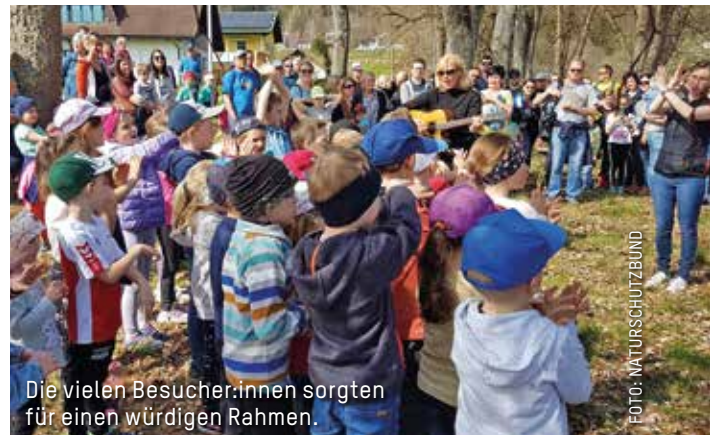
Die vielen Besucher:innen sorgten für einen würdigen Rahmen.