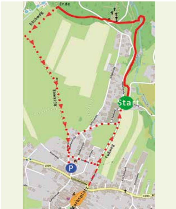
Der Verlauf des Rundweges.

Der Natur in ihrer Vielfalt begegnen kann man am neuen Waldlehrpfad in Aigen-Schlägl. Der rund drei Kilometer lange und mit Schautafeln versehene Rundweg wurde in Zusammenarbeit mit dem Naturschutzbund ausgearbeitet. Offiziell eröffnet wurde er am 22. April 2023.