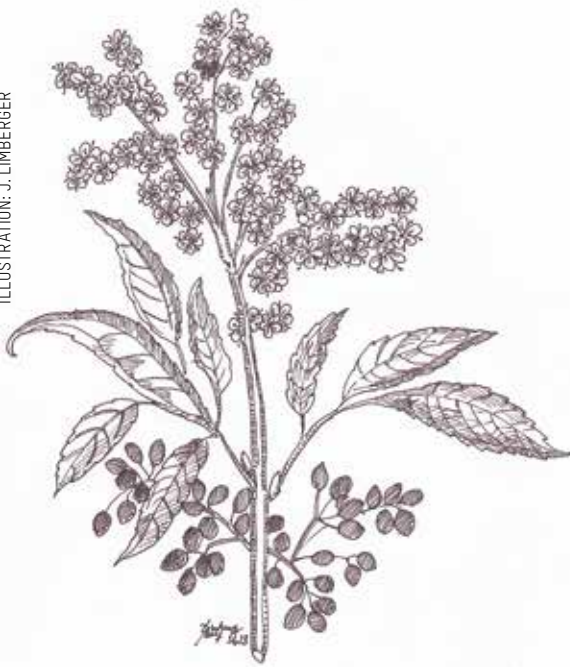
ILLUSTRATION: J. LIMBERGER