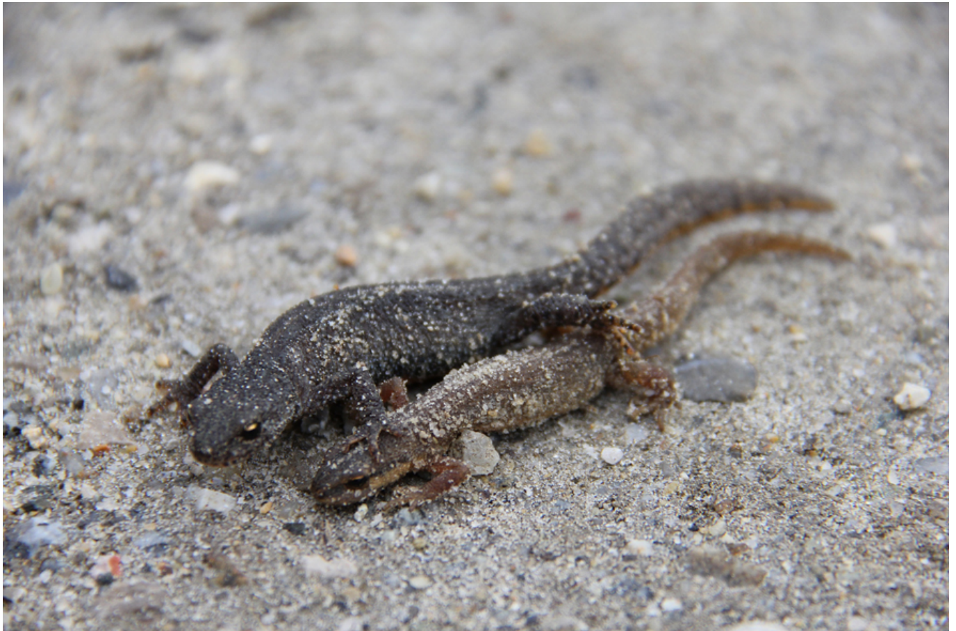
Foto: Teichmolch-Paar, im Hintergrund das dunklere Männchen

Im Jahr 2026 beschäftigt sich der Naturschutzbund Oberösterreich im Rahmen des Interreg-Projekts „Amphibienschutz LINKED“ in einer Artikelserie mit den heimischen Amphibienarten und stellt deren Aussehen, Lebensraum, Lebensweise und Fortpflanzung sowie Möglichkeiten zum Schutz dieser Tiere vor: Der Teichmolch ( Lissotriton vulgaris ) gilt als Überlebenskünstler der Tieflagen und besiedelt oft Habitate, die für andere Molcharten ungeeignet sind.