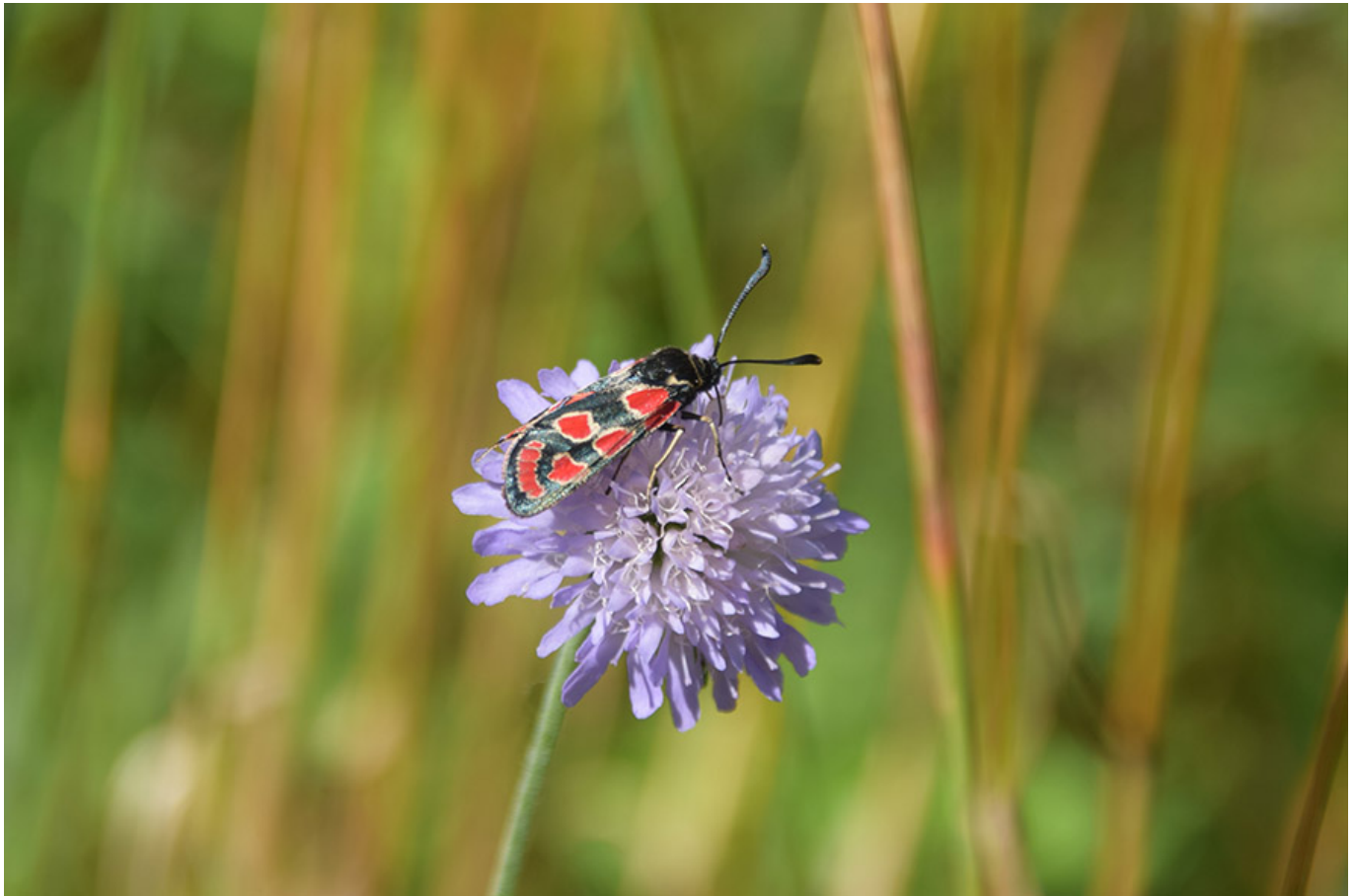
_ Esparsetten-Widderchen ( Zygaena carnolica )

Der Naturschutzbund lädt am Samstag, 12. Juli 2025 von 9:30 bis 12:00 Uhr zu einem Schmetterlingsspaziergang entlang der Linzer Hochwasserschutzdämme im Rahmen des Projekts „Biodiversitätsdaten Insekten“ ein.