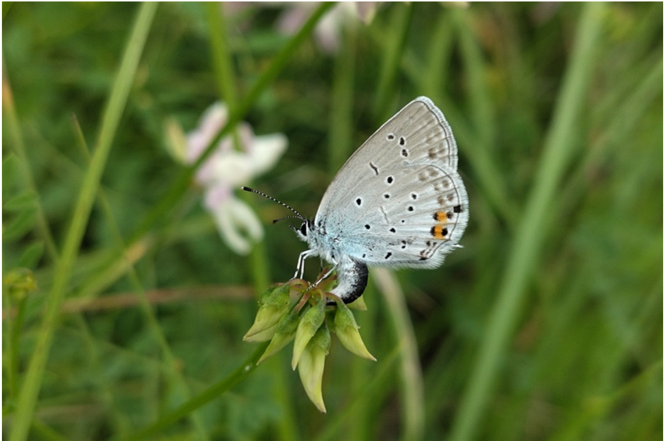
_ Kurzschwänzige Bläuling (Cupido argiades)

Der Naturschutzbund lädt am Samstag, 31. Mai 2025 von 9:30 bis 12:00 Uhr zu einer insektenkundlichen Exkursion ins Naturschutzgebiet „Fuchsenmutter“ im Rahmen des Projekts „Biodiversitätsdaten Insekten“ ein.